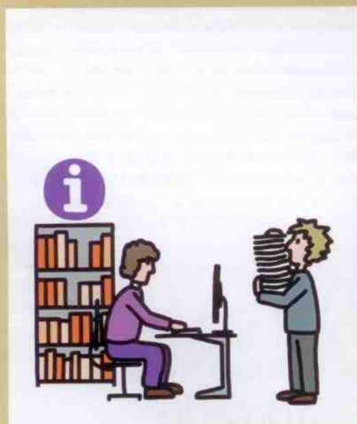
Scenario 1: passieve papieren openbaarheid. Uit: Op weg naar 2020 en verder...